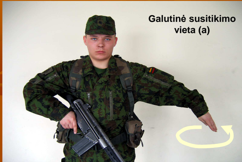
Galutinė susitikimo vieta (a)