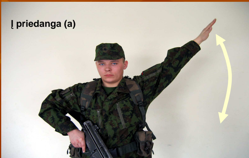
[ priedanga (a)