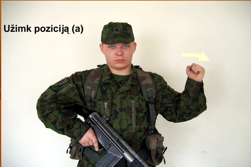
Užimk poziciją (a)