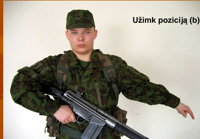
Užimk poziciją (b)