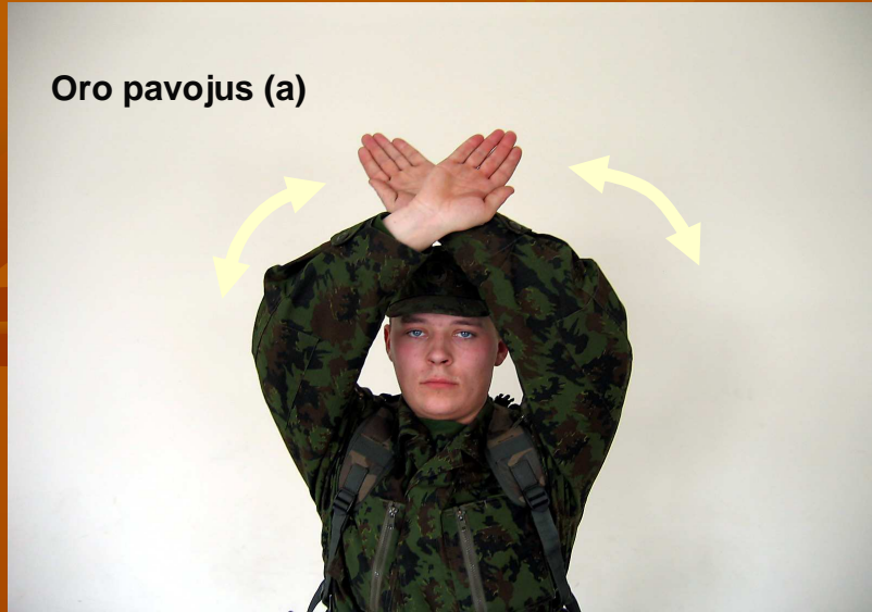
Oro pavojus (a)