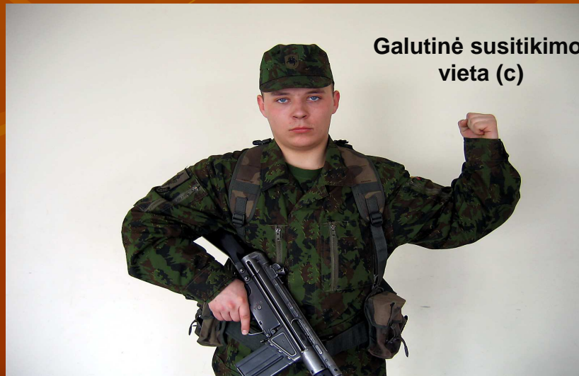
Galutinė susitikimo vieta (c)