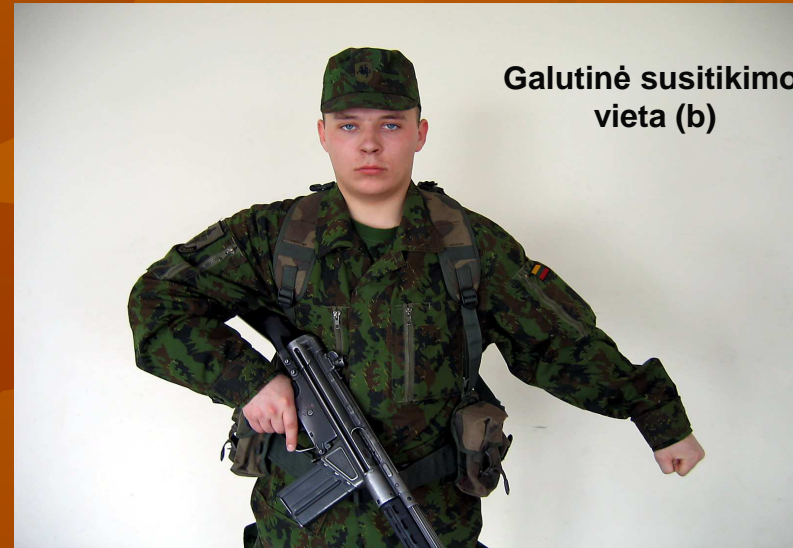
Galutinė susitikimo vieta (b)